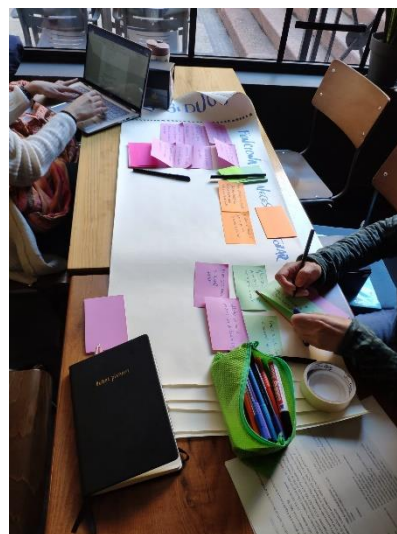
Imagen 1 Trabajo de diagnóstico en la primera asesoría